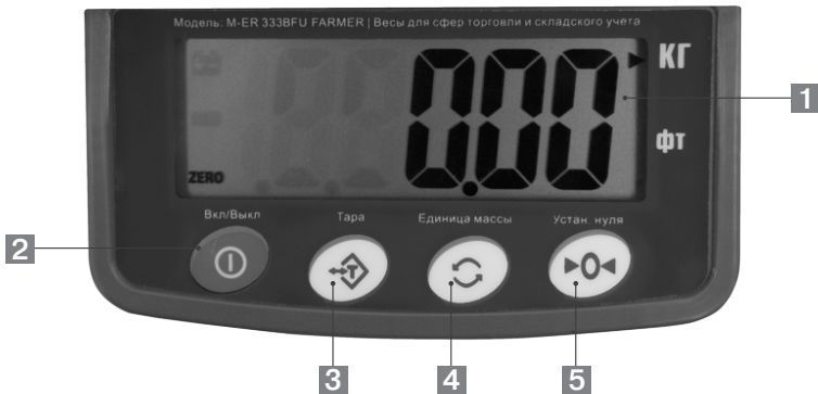
Рис. 2. Терминал управления